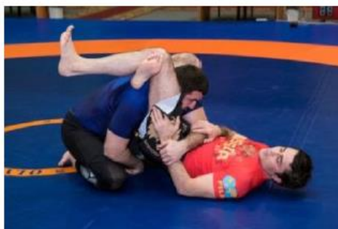
Оппонент защищается от обратного треугольника