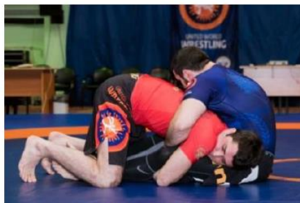
Спина больше 90° от пола