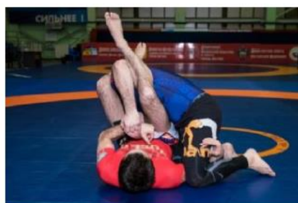
Нет плотно закрытого треугольника