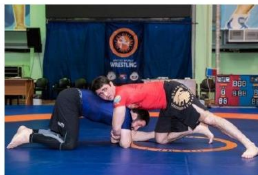
Спортсмены не проводят контроль за руками