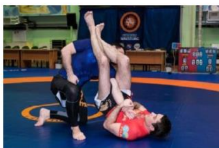
Плотно закрытый треугольник

Примечание: Попытки замков на запястье не оцениваются баллами за атаку.