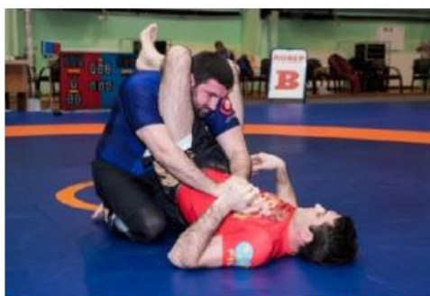
Нет плотно закрытого треугольника