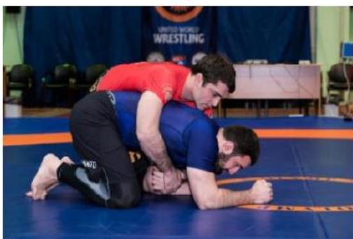
Спортсмены проводят контроль за руками