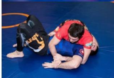
Попытка кумиры без заведения руки за спину соперника