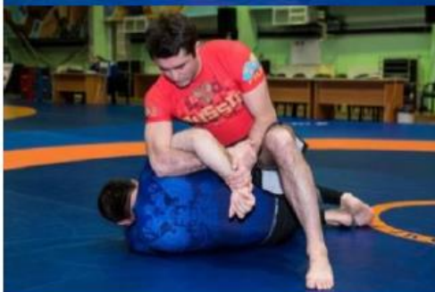
Попытка кумиры с заведением руки