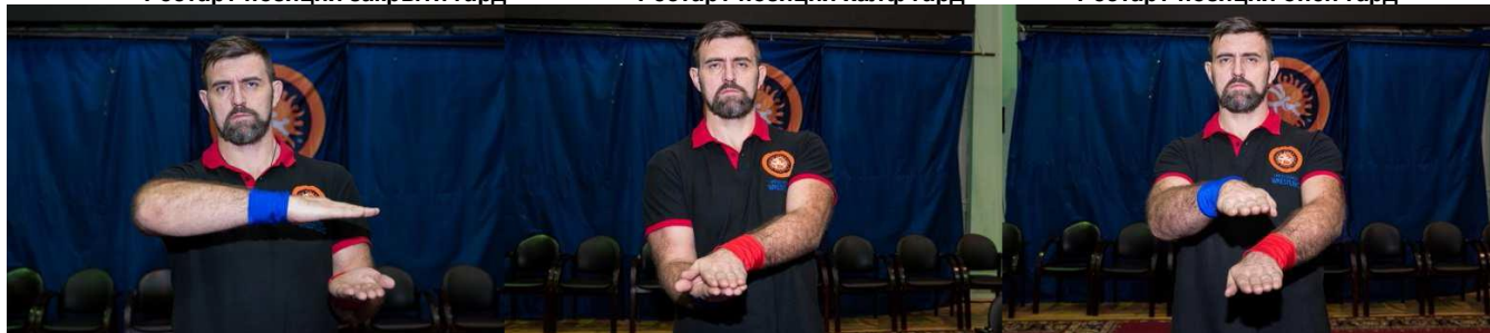
Рестарт-позиция сайд маунт