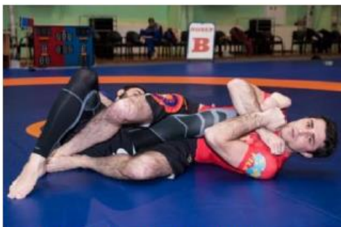
Рычаг колена на незащищенную ногу