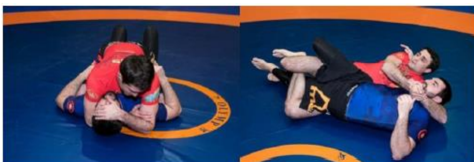
Скручивание шеи или замок со спины