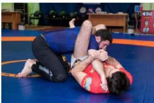
Обратный треугольник и атака на руку