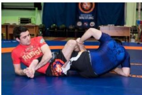
Toe Hold на согнутую в колене ногу