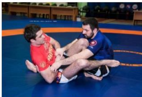
Пример проведения приема, при котором стопа не выпрямлена