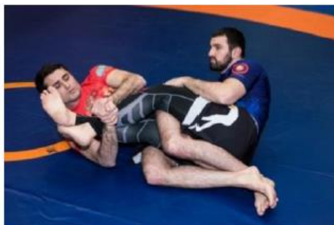
Рычаг колена на защищенную ногу