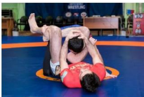
Плотно закрытый треугольник