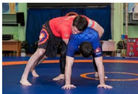
Нет 3 точки контакт и контроль между шей и руками