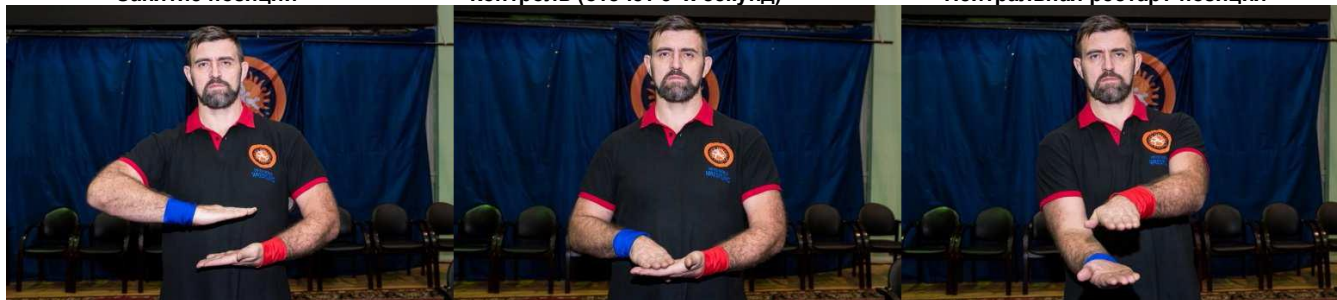
Рестарт-позиция закрытй гард