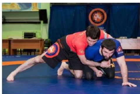
3 точки контакт и контроль между шей и руками