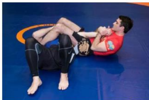
Рука выпрямлена более чем на 90°