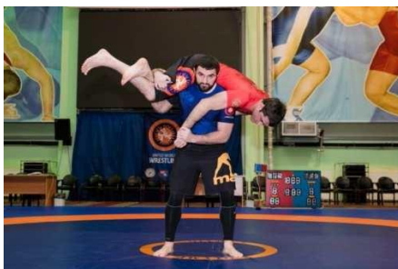
Пример 3-х очкового амплитудного тейкдауна (броска)

Бросок, при котором соперник падает на шею или голову, запрещен.