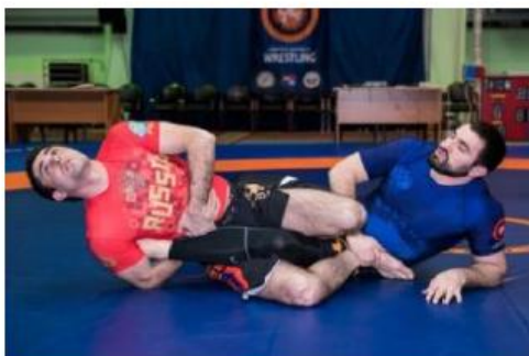
Попытка ущемления ахиллова сухожилия, при которой стопа соперника выпрямлена