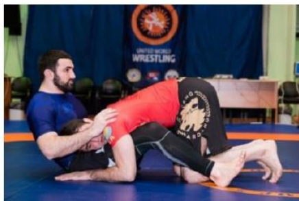
Спина ниже 90°