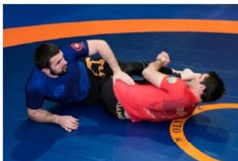
The foot на выпрямленную ногу